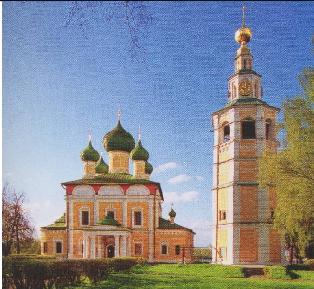
Спасо-Преображенский собор (1700-1706) с колокольней (1730) Угличского Кремля