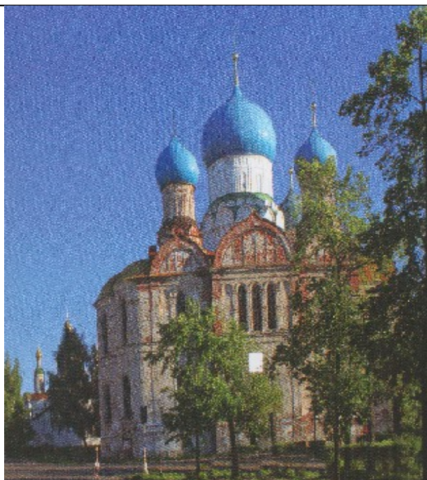
Богоявленский монастырь. Богоявленский собор (1843-1853)