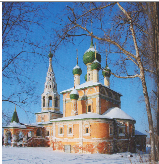
Церковь Рождества Иоанна Предтечи «на Волге» (1690 год)