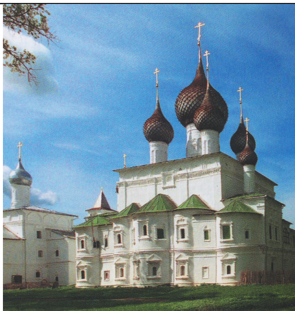
Воскресенский монастырь (1674-1677)