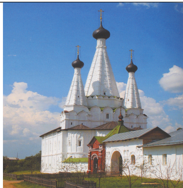
Алексеевский монастырь. «Дивная» церковь (1628)