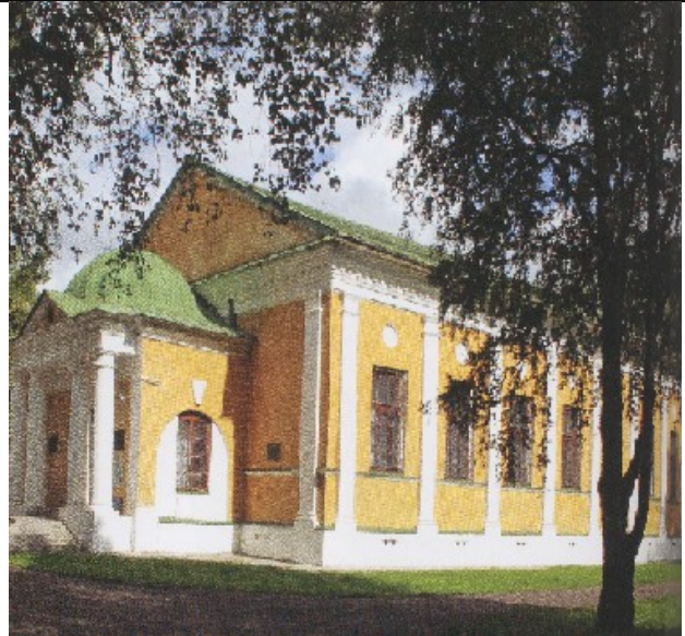
Богоявленский собор (1827) Угличского Кремля