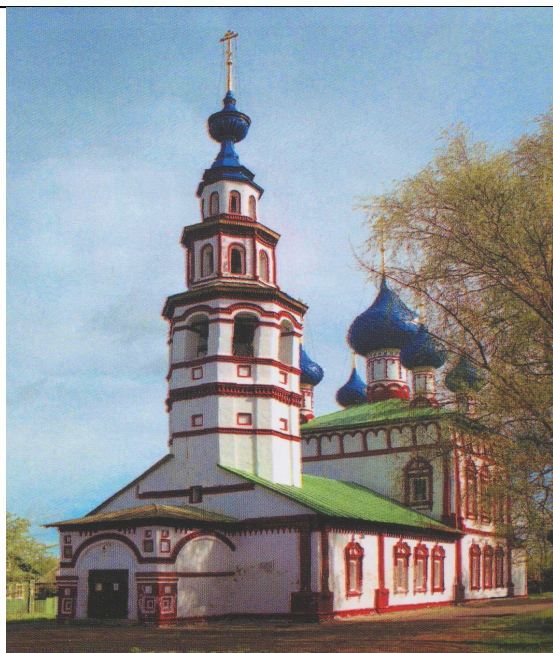
Корсунская церковь (1730 год)