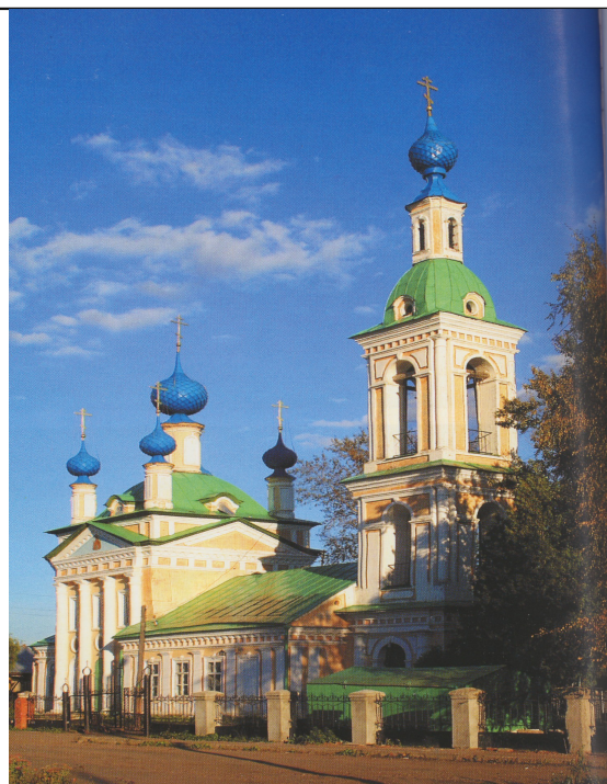
Церковь царевича Димитрия «на поле» (1798-1814)