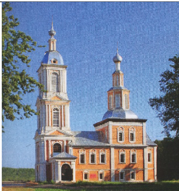
Казанская церковь (1778)