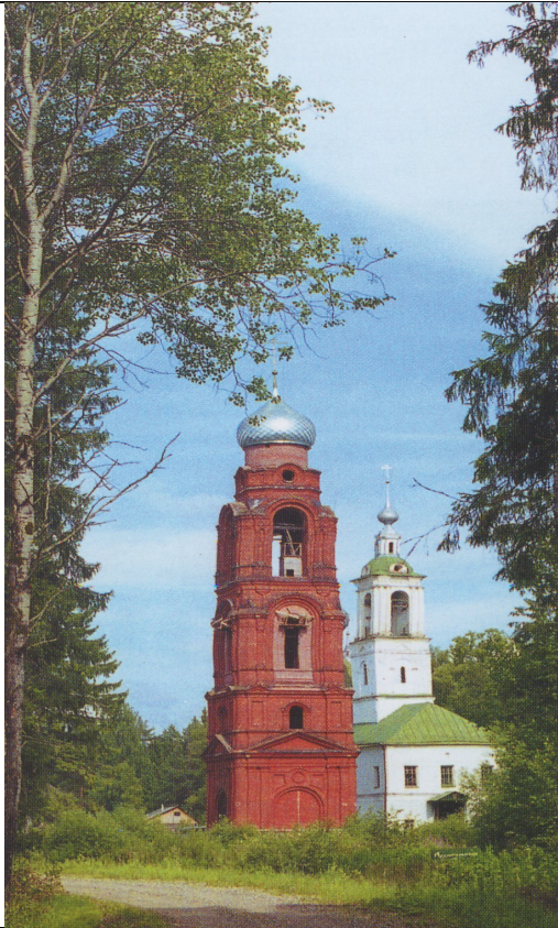
Церковь Михаила Архангела «в бору» (1787) 9 км от Углича за рекой Улеймой